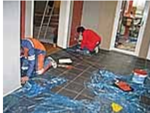
Noen detaljer mangler