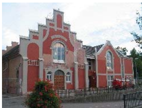
Så langt rakk vi første dagen