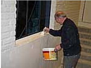
Alt skal være pent til gjeninnvielsen