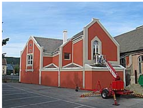
Tilbygget til kirken bakfra