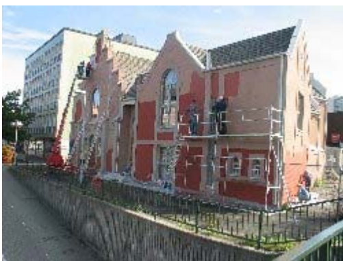
I gang med stiger, stallasjer og lift