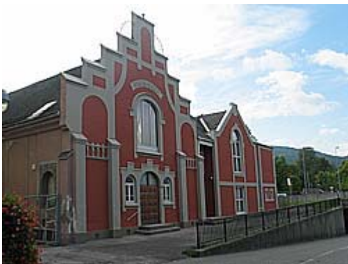
Kirkens fasade ferdig malt

Maling av kirken utvendig september 2003