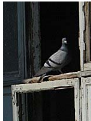
Byduene fant er periode tillhold i kirken. En fase som nå er forbi

En arbeider for å kunne gjeninnvie kirken i overgangen november / desember. Endelig dato er ikke satt enda, men intensjonen er helt klart innvielse før julefeiringen tar til.