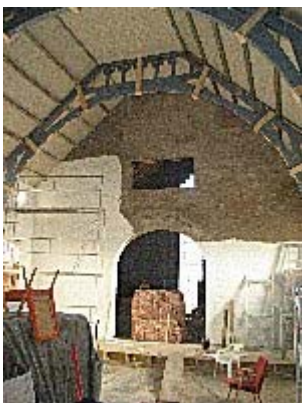
Fondveggen i august