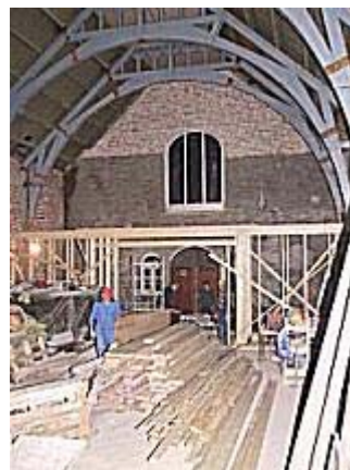
Kirken innvendig mars 03