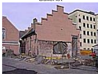
Entreprenøren er i gang