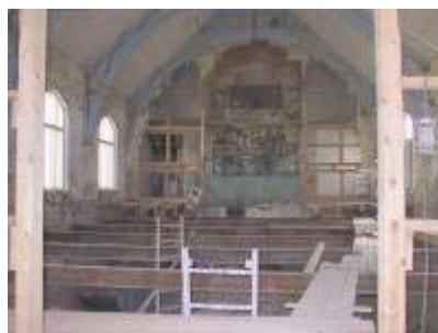
Kirkesalen slik den fremstod 19. august 2001

Etter at en har fullført dette arbeidet vil en legge gulv og legge nytt tak innvendig og utvendig. Etter dette vil den endelige innredningen komme på plass. Dessuten skal en i løpet av den samme perioden bygge et tilbygg der dåpsbasseng og omkleddingsrom plasseres, og kirken skal føyes sammen med det eksisterende menighetssenteret.