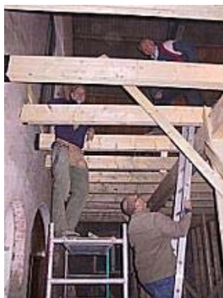
Galleriets bæring på plass

Det utvendige tilbygget er i ferd med å reise seg når en nærmer seg slutten av mars. Armering og støp til fundament for vegger har kommet opp. Dåpsbassenget har funnet sin plass og form, og galleriet er på plass. Under galleriet blir kirkens inngangsparti med hall, garderobe og toaletter. Galleriet vil i tillegg til å gi ekstra sitteplasser også gi plass til orgelet. En har dessverre kommet til at innvielsesdagen, som var bestemt til 1. pinsedag må utsette til høsten. I forhold til framdriften så langt er det realistsisk at bygget kan "lukkes" før sommeren med montering av vinduer og dører i siste del av juni, slik at en innen den tid i størst mulig grad er ferdig med maling, mur- og snekkerarbeider innendørs. Etter at sluttarbeidene er utført innendørs er det rimelig å kunne forvente innvielse i september / oktober. endelig dato for dette vil bli fastsatt medio mai måned.