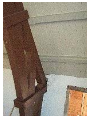
Detalj fra tak